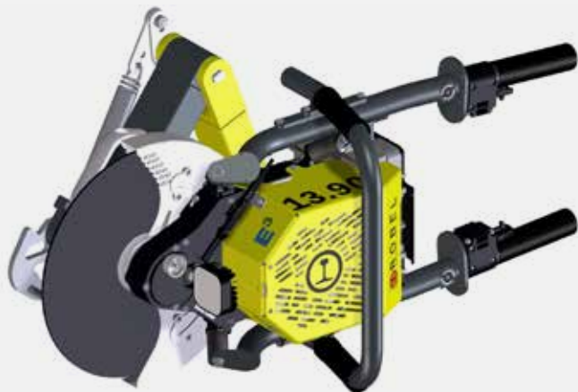
ROCUT 13.90 – 5909900008