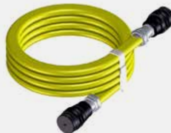
Câble de raccordement – 5016060210