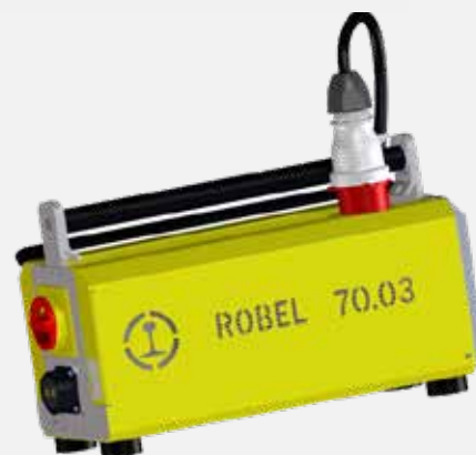
Bloc d'alimentation 400 Volt – 5039900003