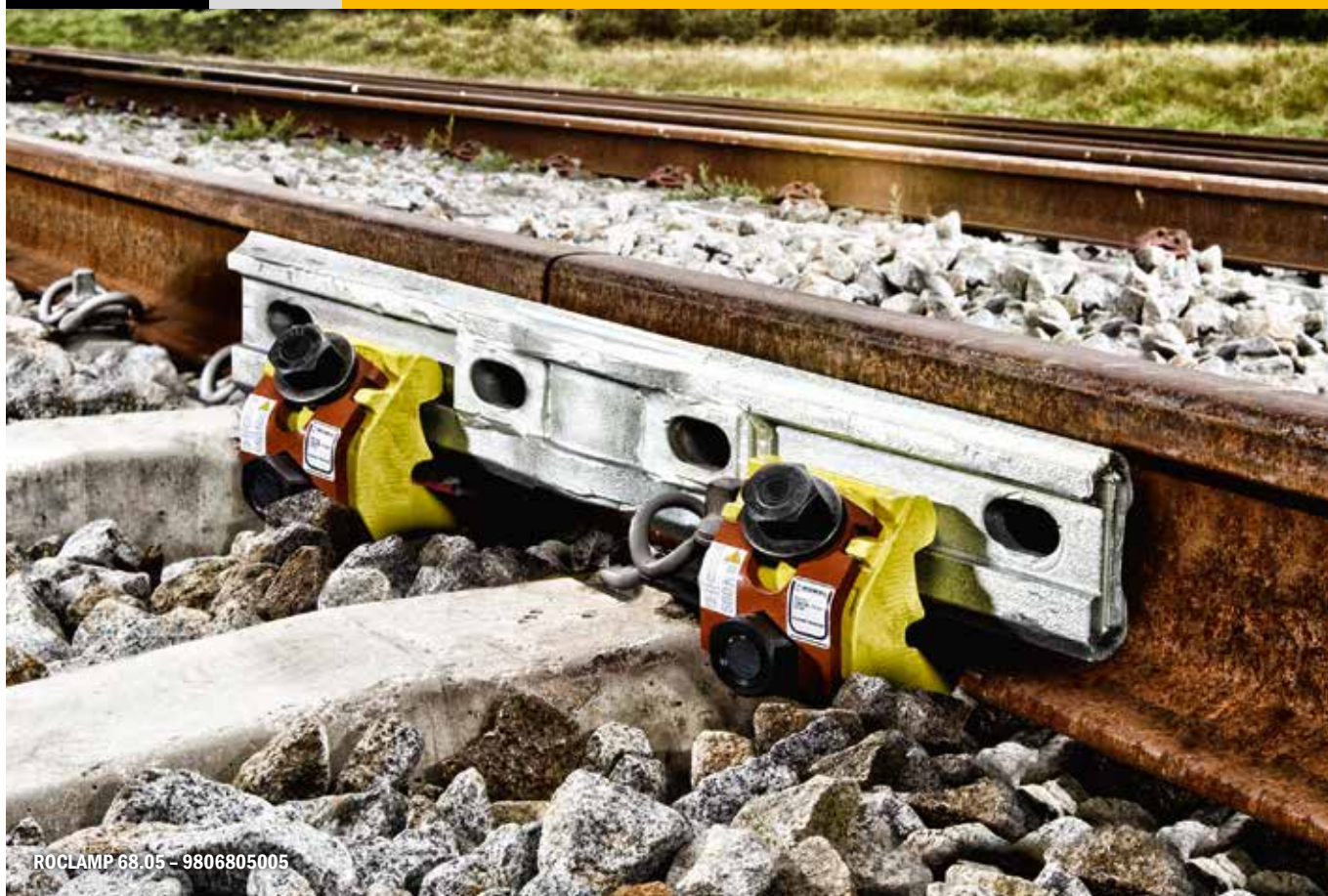
ROCLAMP 68.05 - 9806805005

Zur formschlüssigen und sicheren Verbindung von zwei Schienenenden.