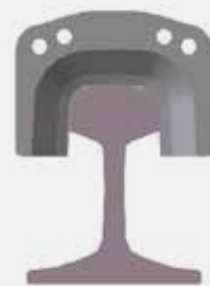
Scherschuh FORM B