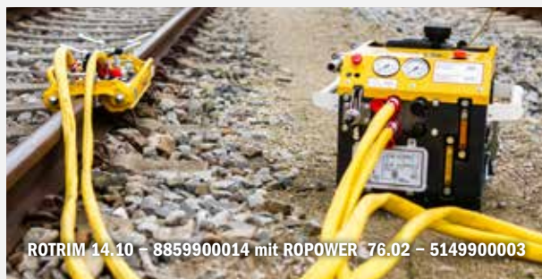
ROTRIM 14.10 – 8859900014 mit ROPOWER 76.02 – 5149900003