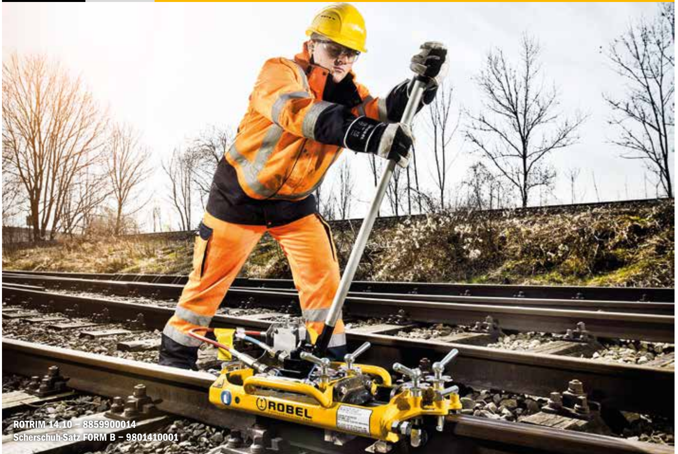
ROTRIM 14.10 - 8859900014 Scherschuh-Satz FORM B - 9801410001

Zum Abscheren von alumino-thermischen Schienenschweißungen.