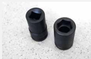
Винтовая ударная головка RK 24 x 28 для квадрата Винтовая ударная головка SW 39 для шестигранника

9871033319 винтовая ударная уголовка VK 24 x 24 Дополнительные винтовые головки по запросу.