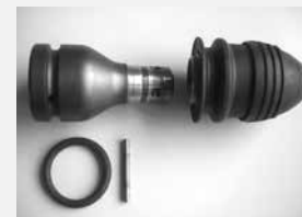
Патрон для сверления SDS-Plus

8099910001 SDS-Plus патрон для сверления, для сверления отверстий в шпалах