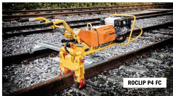
ROCLIP P4 FC