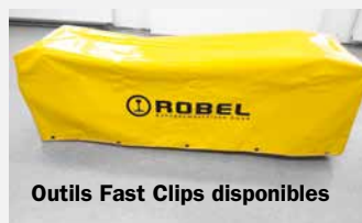
Outils Fast Clips disponibles