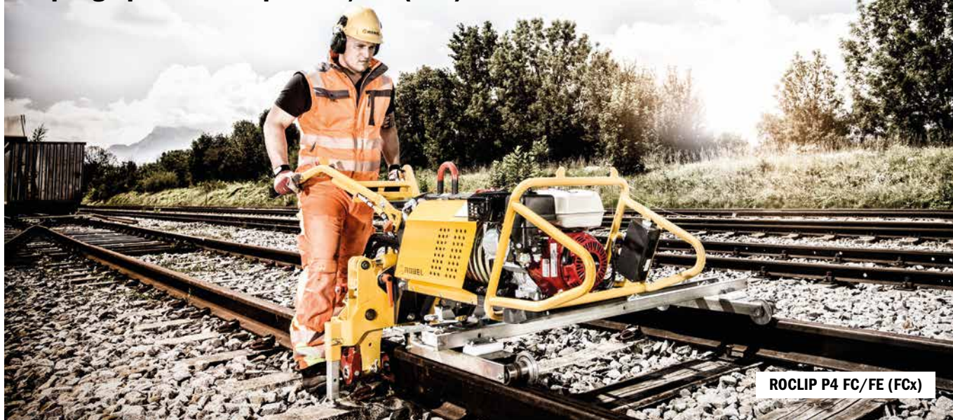
ROCLIP P4 FC/FE (FCx)