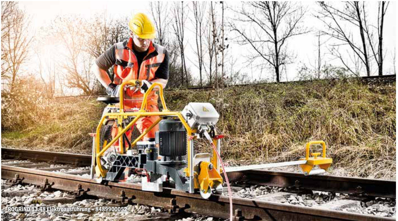
ROGRIND 13.48 Elektroausführung – 8489900052