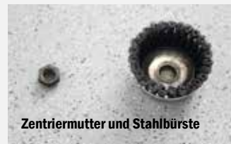
Zentriermutter und Stahlbürste